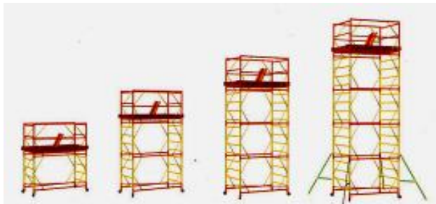
ВТП 0,8x1,7 облегченная

Стабилизаторы в стоимость вышки не входят.